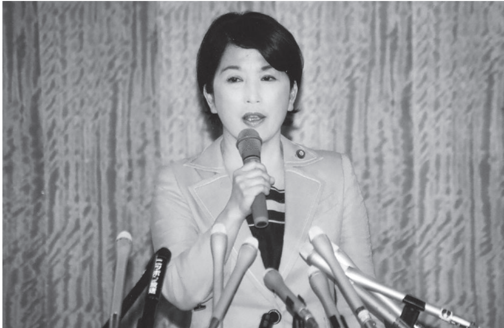
「辺野古」と書かれた閣議決定への署名を拒否。大臣罷免後の会見にて(5月28日)

社会新報 号外 発行所 社会民主党全国連合機関紙宣伝局 週刊(水曜日発行)〒100-0014 東京都千代田区永田町1-8-1 電話 代表03(3580)1171 振替 00140-1-3203 ●定価180円●1ヵ月700円●送料160円