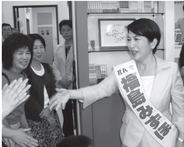
参議院選挙スタート。選挙事務所で出発式。さすがにちょっと緊張気味? (6月24日)