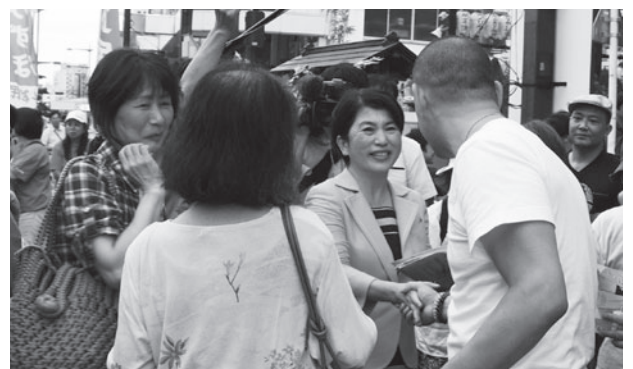
巣鴨地蔵通り商店街の練り歩きで多くの仲間に支えられながら政策チラシを配り、また、多くの方々から激励をいただきました。(7月3日)