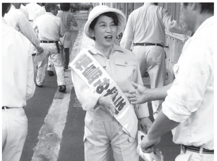
子ども時代を過ごした宮崎は口蹄(てい)疫問題で選挙どころではない状況でした。(6月28日)